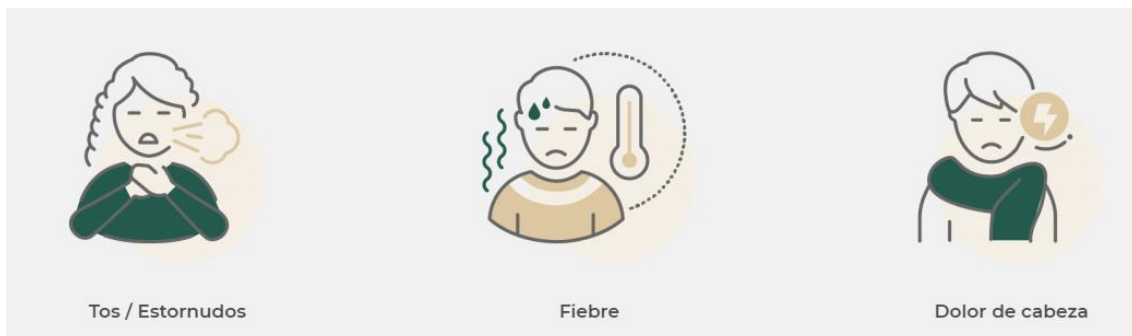
Tos / Estornudos