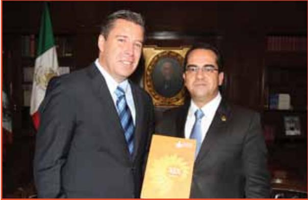
PODER EJECUTIVO.- El Gobernador, Miguel Márquez Márquez , recibe del Procurador de los Derechos Humanos del Estado de Guanajuato, el XIX Informe de Actividades.

En cumplimiento a lo dispuesto por el artículo 16, fracción XIII, de la ley para la Protección de los Derechos Humanos en el Estado de Guanajuato, el Ombudsman, Gustavo Rodríguez Junquera entregó a los titulares de los Poderes en el Estado, el XIX Informe de Actividades , que comprende el período Enero – Noviembre de 2012 .