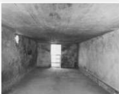
FOTOGRAFÍA Interior de una cámara de gas

Conoce el Artículo: Fechas clave en la negación del Holocausto, cuya cronología incluye algunos acontecimientos clave en la evolución de la negación del Holocausto.